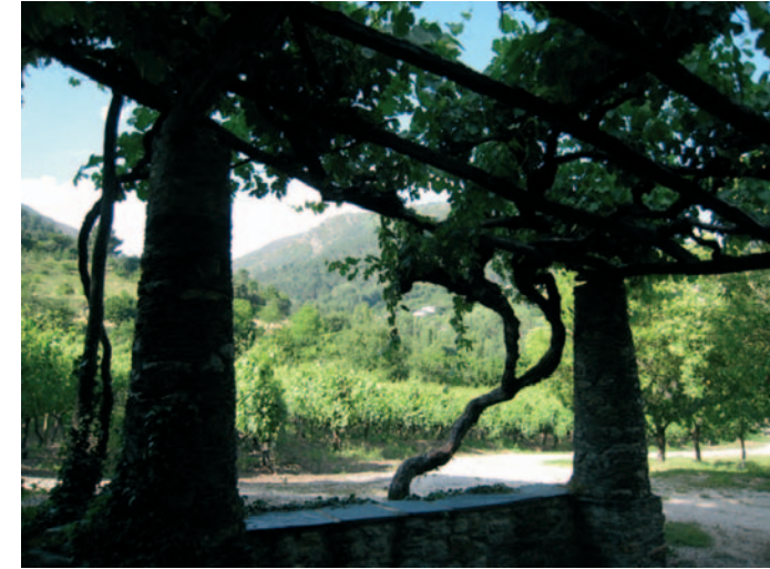
Paisaxe do viño no Mosteiro de Xagoaza